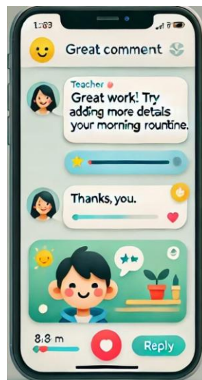
Gambar 2. Tampilan fitur komentar seesaw

Hasil penelitian menunjukkan bahwa pemberian umpan balik interaktif melalui fitur komentar di Seesaw berperan penting dalam meningkatkan keterampilan berbicara dan menulis siswa dalam bahasa Inggris. Guru memanfaatkan fitur ini untuk memberikan tanggapan langsung terhadap tugas yang diunggah siswa, baik dalam bentuk teks, suara, maupun video. Dengan adanya umpan balik yang cepat dan personal, siswa lebih memahami kesalahan mereka dan termotivasi untuk memperbaiki serta meningkatkan kualitas kerja mereka. Dari hasil observasi dan analisis unggahan siswa, ditemukan bahwa siswa yang menerima umpan balik secara rutin menunjukkan perbaikan yang lebih signifikan dibandingkan dengan siswa yang jarang mendapatkan komentar atau hanya menerima penilaian dalam bentuk angka. Siswa cenderung lebih responsif terhadap umpan balik yang bersifat spesifik, seperti koreksi tata bahasa dalam tulisan mereka atau saran mengenai pengucapan dan intonasi dalam rekaman berbicara. Guru juga menggunakan fitur komentar suara untuk memberikan contoh pelafalan yang benar, sehingga siswa dapat langsung menirukan dan mempraktikkannya kembali.