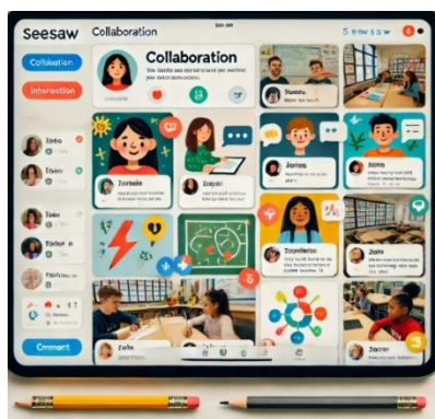
Gambar 4. Tampilan fitur kolaborasi dan interaksi pembelajaran bahasa inggris seesaw

Inggris. Melalui fitur ini, siswa dapat saling berbagi hasil tugas, memberikan komentar, serta berdiskusi secara aktif dengan teman-temannya. Aktivitas ini menciptakan lingkungan belajar yang lebih interaktif dan mendorong siswa untuk lebih percaya diri dalam menggunakan bahasa Inggris, baik secara lisan maupun tulisan. Hasil observasi kelas, terlihat bahwa siswa yang aktif berinteraksi dengan teman melalui Seesaw cenderung lebih cepat mengembangkan keterampilan bahasa mereka dibandingkan dengan siswa yang pasif. Mereka tidak hanya mengunggah tugas individu, tetapi juga terlibat dalam diskusi dengan memberikan tanggapan terhadap tugas teman. Interaksi ini memberikan kesempatan bagi siswa untuk mempelajari berbagai cara penyampaian ide serta memperkaya kosakata mereka. Selain itu, siswa yang awalnya kurang percaya diri dalam berbicara dan menulis menunjukkan peningkatan keberanian karena mereka merasa didukung oleh komunitas belajar yang positif.